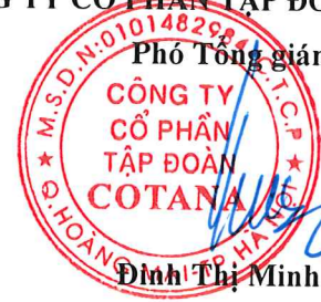
Trần Trọng Đại