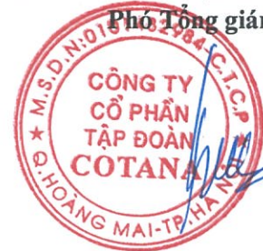
Trần Trọng Đại