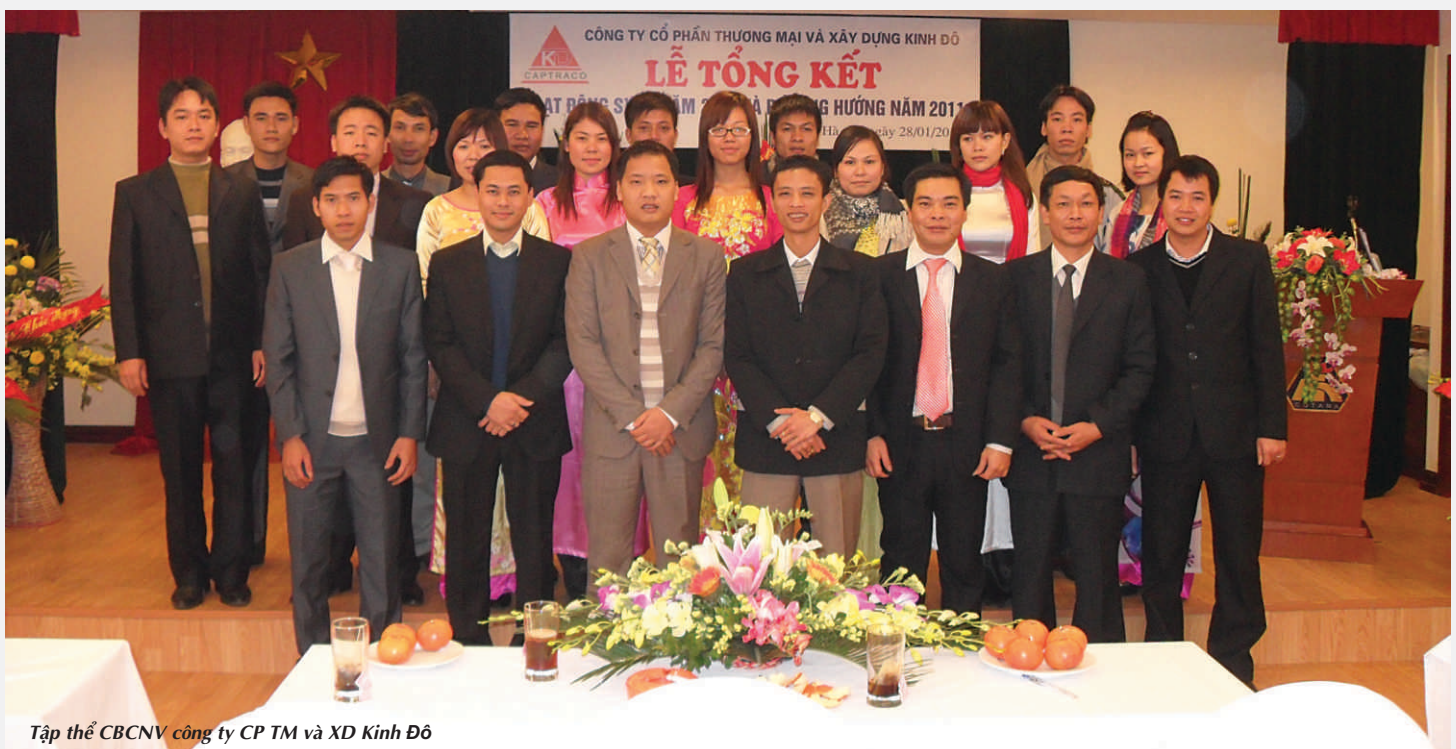
Tập thể CBCNV công ty CP TM và XD Kinh Đô