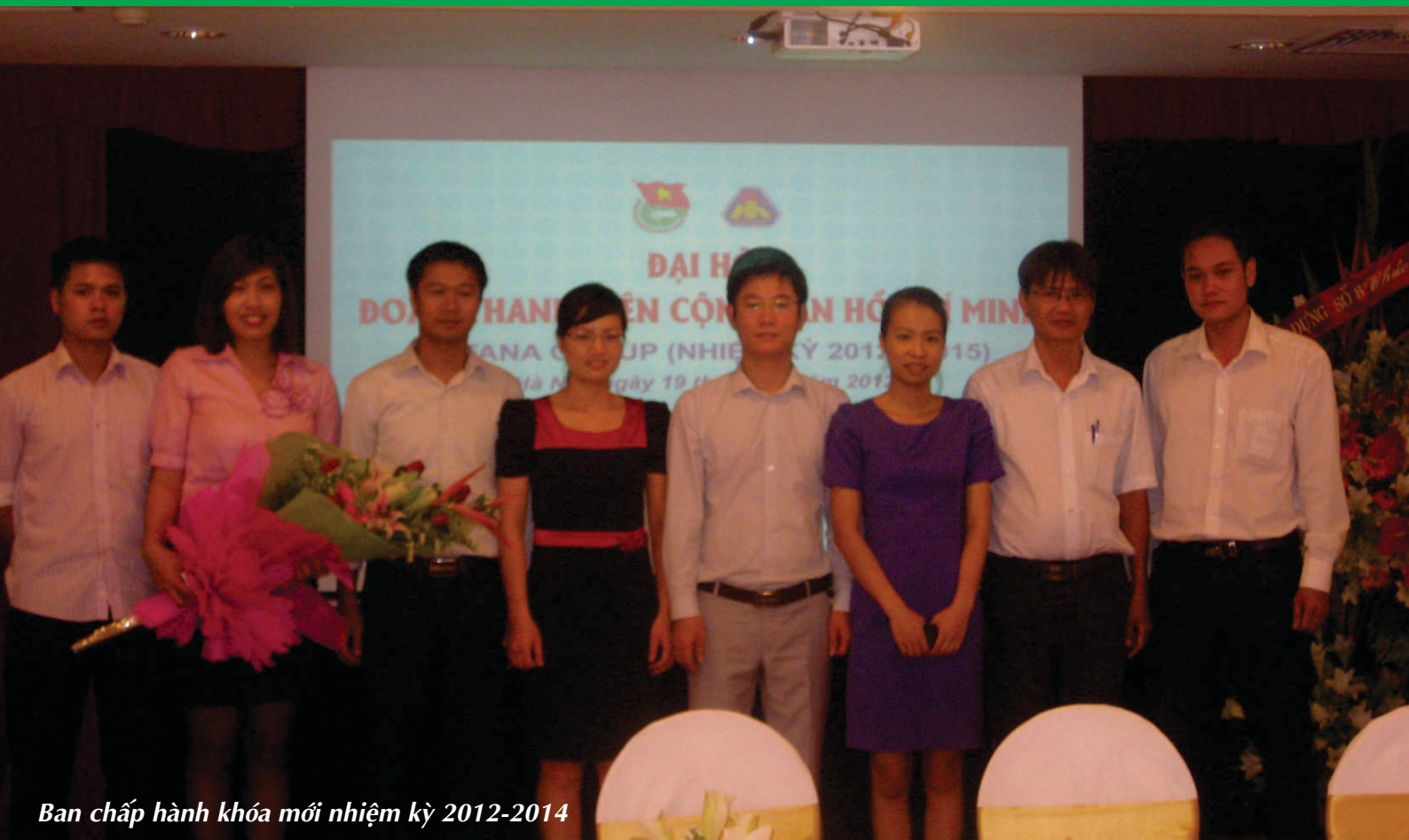
Ban chấp hành khóa mới nhiệm kỳ 2012-2014

Sáng ngày 19/5/2012 tại hội trường tầng 10 trụ sở Công ty Đoàn thanh niên COTANA GROUP đã tiến hành đại hội đoàn nhiệm kỳ 2012-2014. Hiện nay đoàn thanh niên COTANA GROUP gồm 5 chi đoàn trực thuộc. Với nhân sự BCH Đoàn thanh niên gồm