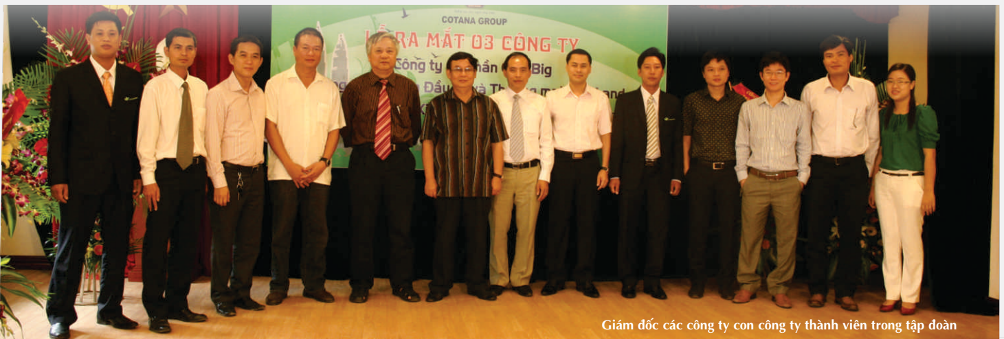
Giám đốc các công ty con công ty thành viên trong tập đoàn

Hiện nay, các gói giải pháp của Chính phủ đã phát huy tác dụng, kinh tế vĩ mô cũng dần ổn định, các doanh nghiệp có các hướng đi khác nhau tạo nên một trật tự mới cho thị trường đây cũng chính là những cơ hội cho các doanh nghiệp.