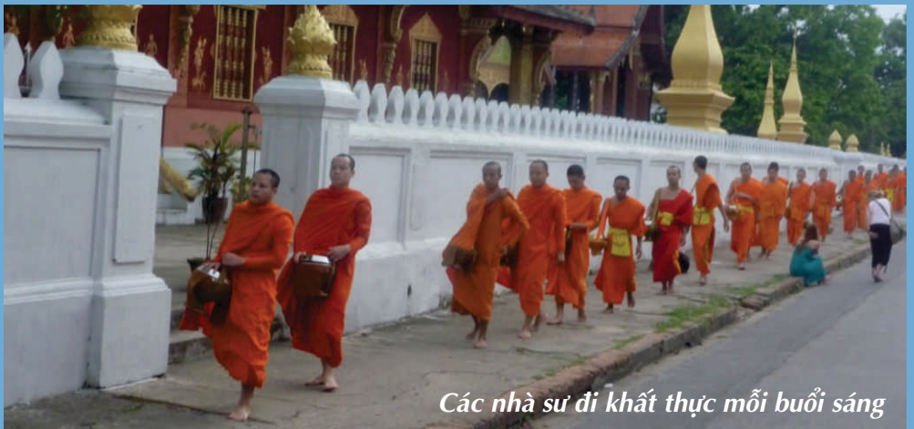
Các nhà sư đi khất thực mỗi buổi sáng

đặc trưng nhất của Luang Prabang. Mỗi du khách khi tới đây đều cố gắng dậy sớm để được ngắm nhìn cái hình ảnh vừa bình yên vừa bình dị ấy, và muốn một lần quỳ bên đường cùng những người dân mang đồ ăn, bánh kẹo cho các nhà sư.