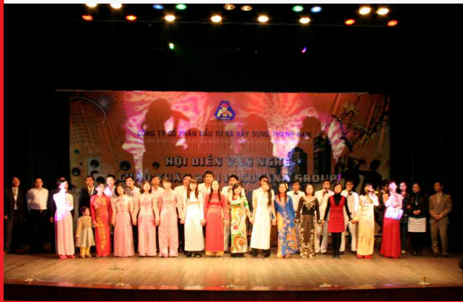
Đội văn nghệ Đoàn thanh niên COTANA GROUP thu hút sự tham gia của rất nhiều đoàn viên

và tinh thần hăng say lao động của con người Việt Nam. Liên hoan văn nghệ được đánh giá cao qua những tiết mục tiêu biểu, tạo ấn tượng sâu sắc và cảm xúc tốt đẹp trong lòng khán giả.