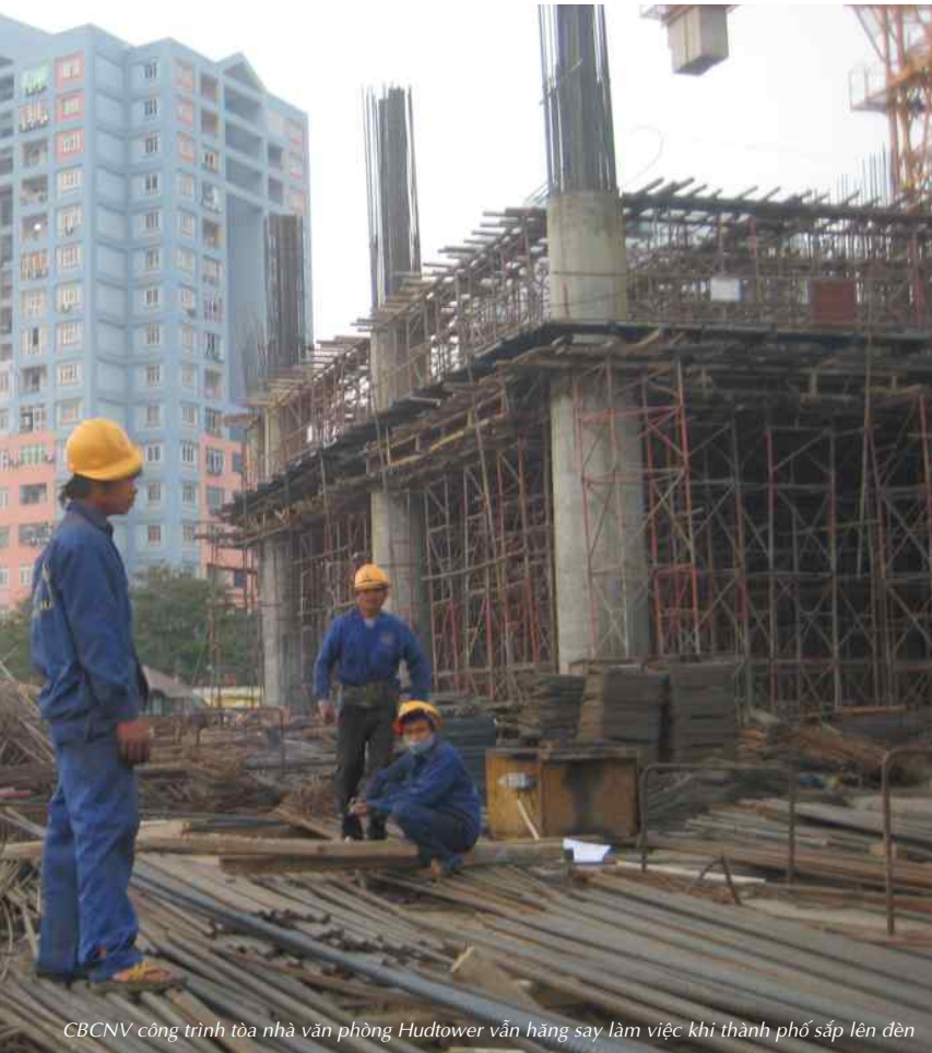
CBCNV công trình tòa nhà văn phòng Hudtower vẫn hăng say làm việc khi thành phố sắp lên đèn

Được xuôi chuẩn bị đón xuân thì ở khắp các công trường của COTANA, anh em tất bật triển khai và “bám” công trình để hoàn thành đúng tiến độ