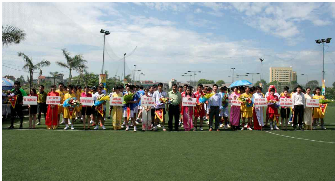
COTANA League- Giải đấu Bóng đá truyền thống của COTANA GROUP