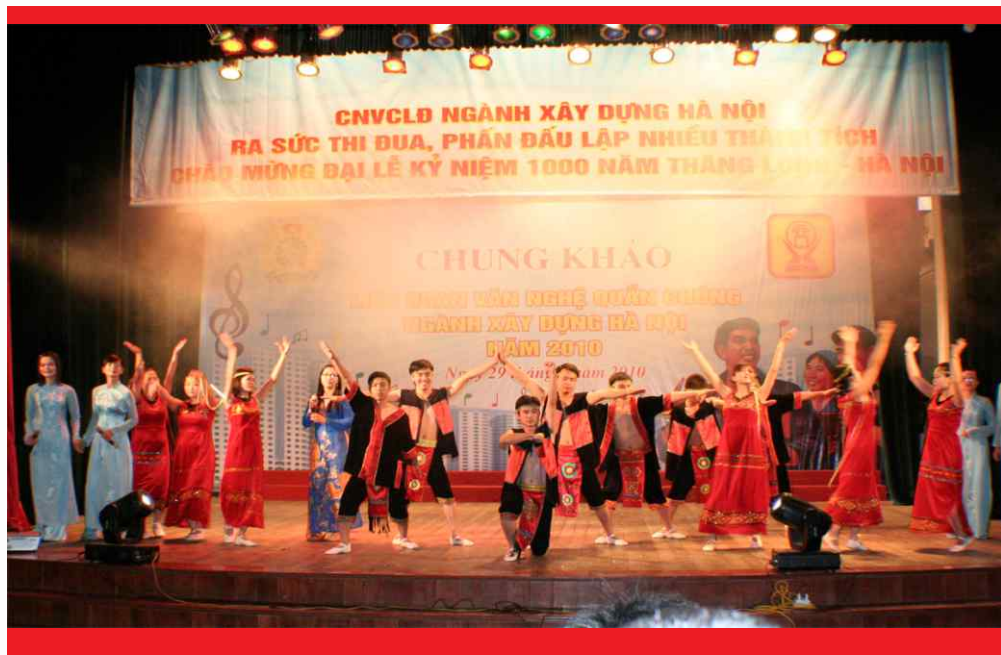
Tích cực tham gia các sự kiện trong và ngoài Tập đoàn

Tham gia chương trình, các diễn viên và ca sỹ không chuyên đều là cán bộ, nhân viên trong toàn COTANA GROUP đã cố gắng hết mình và mang đến cho người xem những lời ca, tiếng hát ca ngợi mùa xuân, đất nước, ca ngợi người kỹ sư, công nhân ngành Xây dựng trong quá trình dựng xây đất nước thời đại mới. Những ca