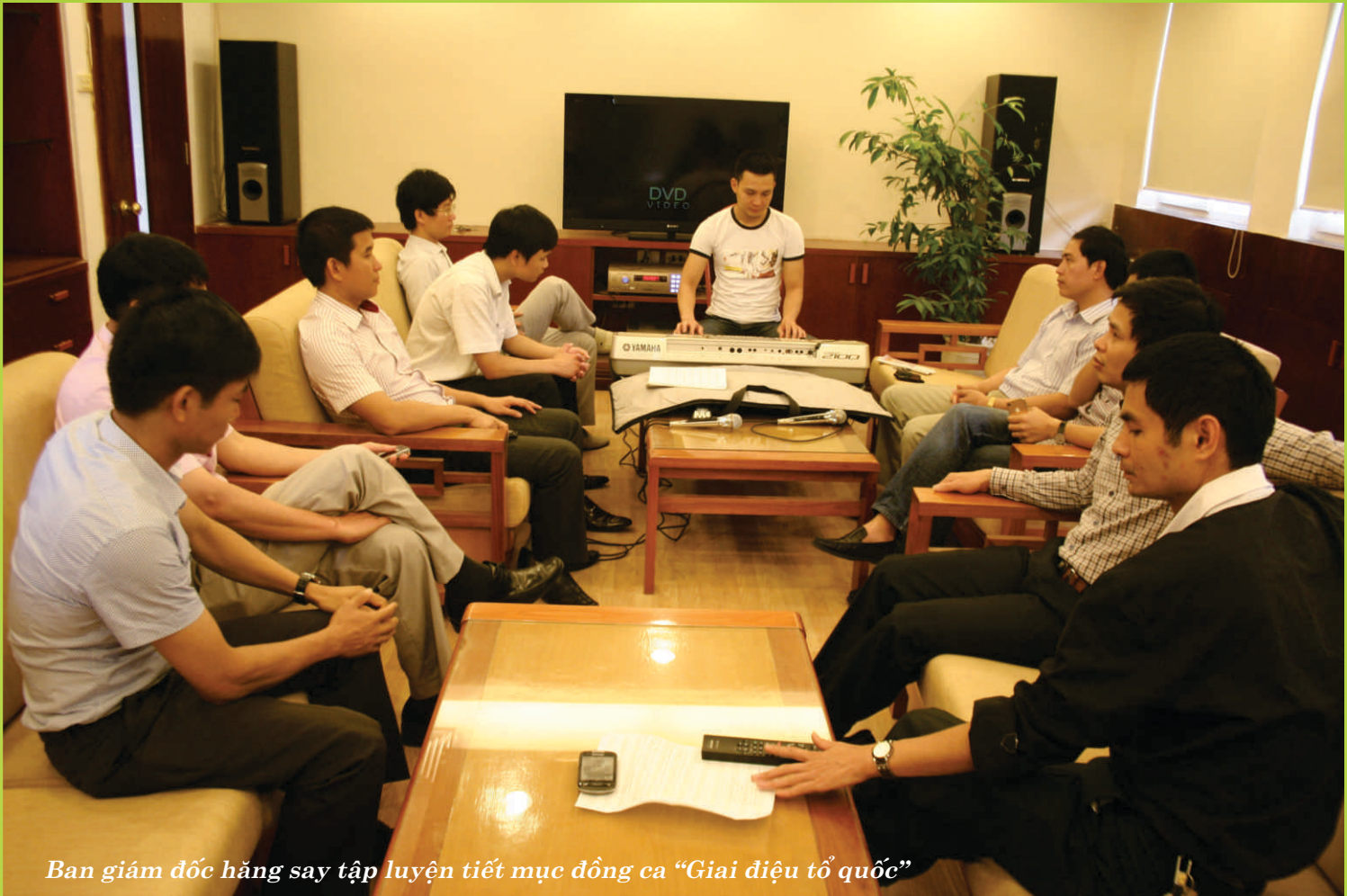
Ban giám đốc hằng say tập luyện tiết mục đồng ca “Giai điệu tổ quốc”