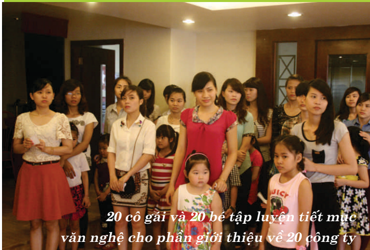
20 cô gái và 20 bé tập luyện tiết mục văn nghệ cho phần giới thiệu về 20 công ty