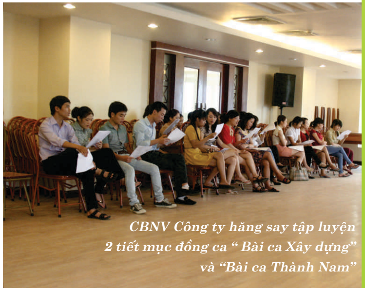
CBNV Công ty hăng say tập luyện 2 tiết mục đồng ca “ Bài ca Xây dựng” và “ Bài ca Thành Nam”