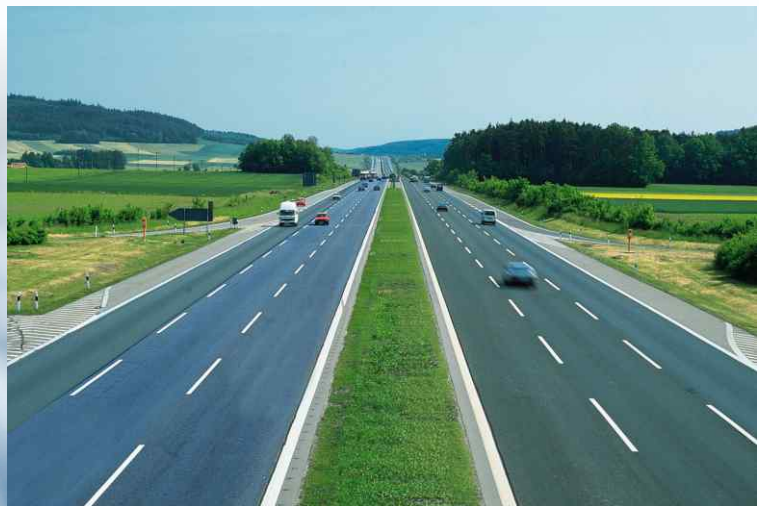
Dự án BOT quốc lộ 6