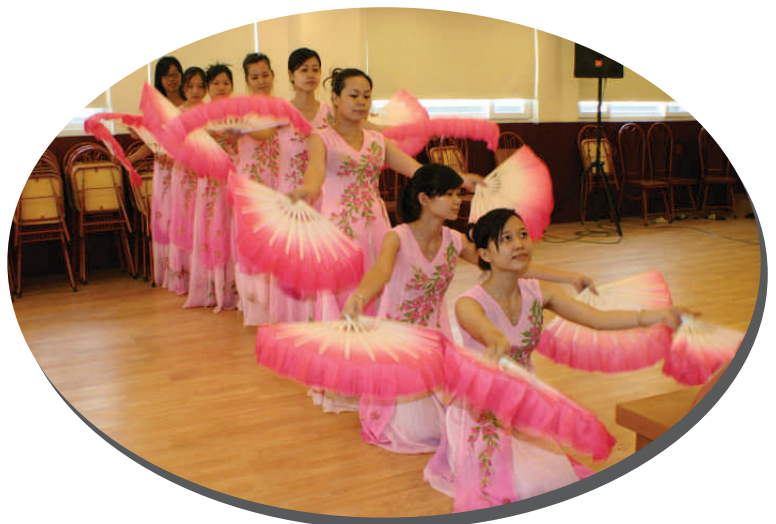
CBNV nữ tham gia hoạt động văn nghệ

Với đội ngũ nhân viên nữ “Giỏi việc nước, đảm việc nhà” trong nền văn hoá mới, văn hoá COTANA GROUP, Ban lãnh đạo Công ty tin tưởng rằng Tập đoàn của chúng ta ngày càng vững mạnh hơn nữa.