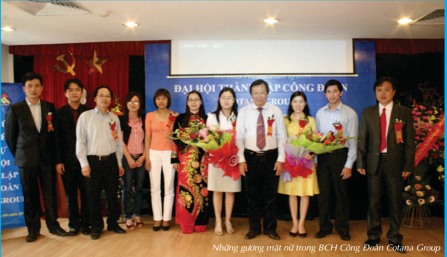
Những gương mặt nữ trong BCH Công Đoàn Cotana Group