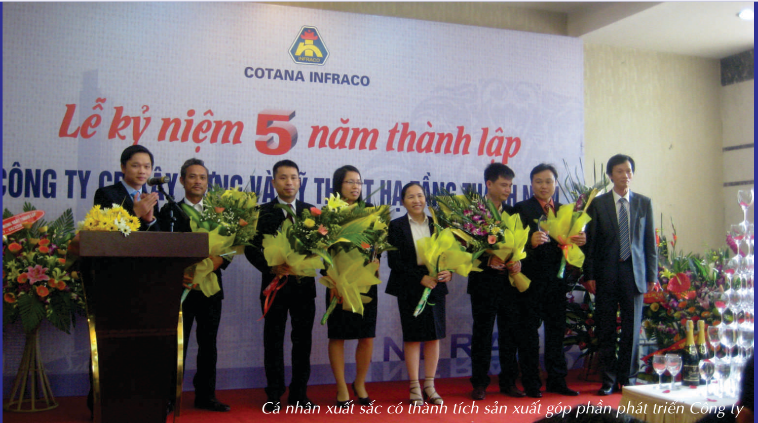
Cá nhân xuất sắc có thành tích sản xuất góp phần phát triển Công ty

05 năm không phải là dài cho một thành công cũng không phải là ngắn so với những khó khăn, gian lao mà ban lãnh đạo cùng toàn thể cán bộ công nhân viên của Công ty Cổ phần Xây dựng và Kỹ thuật Hạ tầng Thành Nam (COTANA INFRACO) đã trải qua.