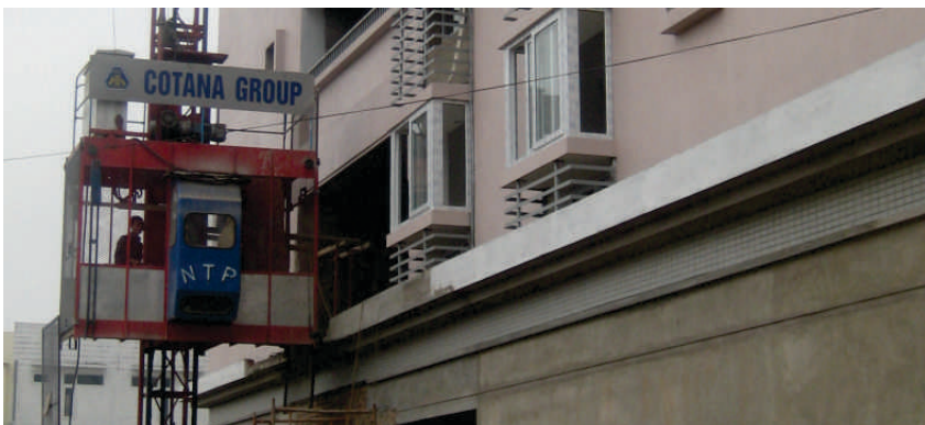
Công trình 14 tầng, Green House đang ở giai đoạn cuối.

công, xây dựng tiến độ thi công cụ thể cho từng mục, gắn kết các tập thể, cá nhân trên công trường là một khối sức mạnh chung thống nhất. Có chế độ thưởng phạt công minh, khuyến khích động viên kịp thời những tập thể cá nhân có thành tích lao động xuất sắc, đẩy mạnh phong trào thi đua lao động sôi nổi trên công trường. Mỗi cán bộ kỹ thuật luôn ý thức được trách nhiệm nặng nề và to lớn của mình trong công việc để cùng đoàn kết, gắn bó và hỗ trợ nhau trong công việc vì mục tiêu chung hoàn thành đúng tiến độ của mỗi dự án.