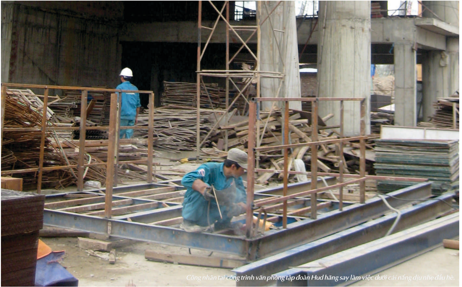
Công nhân tại công trình văn phòng tập đoàn Hud hăng say làm việc dưới cái nắng dịu nhẹ đầu hè.

công, xây dựng tiến độ thi công cụ thể cho từng mục, gắn kết các tập thể, cá nhân trên công trường là một khối sức mạnh chung thống nhất. Có chế độ thưởng phạt công minh, khuyến khích động viên kịp thời những tập thể cá nhân có thành tích lao động xuất sắc, đẩy mạnh phong trào thi đua lao động sôi nổi trên công trường. Mỗi cán bộ kỹ thuật luôn ý thức được trách nhiệm nặng nề và to lớn của mình trong công việc để cùng đoàn kết, gắn bó và hỗ trợ nhau trong công việc vì mục tiêu chung hoàn thành đúng tiến độ của mỗi dự án.