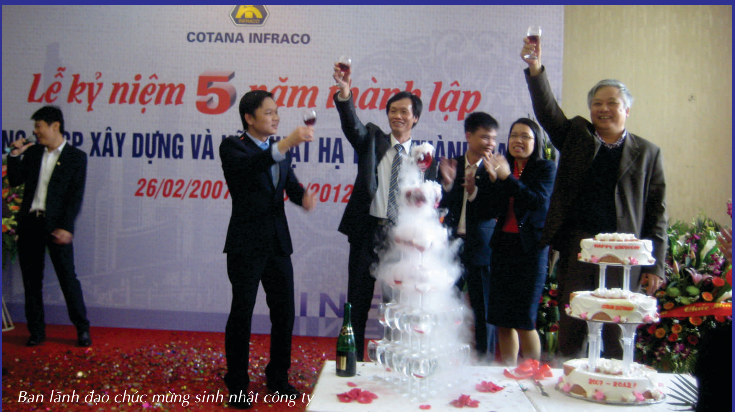
Ban lãnh đạo chúc mừng sinh nhật công ty